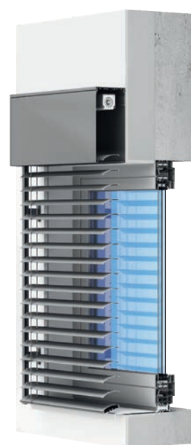
żaluzja fasadowa/adaptacyjna /nadtynkowa-uchwyty